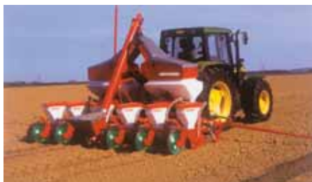
Semeador-fertilizador de precisão, monogrão, pneumático, c/ sem-fim de carga