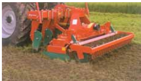
Grades Rotativas de Eixo Vertical (Rototerras) montadas, profundidade até 25 cm e Larg. de trabalho: 2 a 6m. Podem ser combinadas com vários tipos de rolos