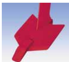
Fig. 2 – Relha simétrica