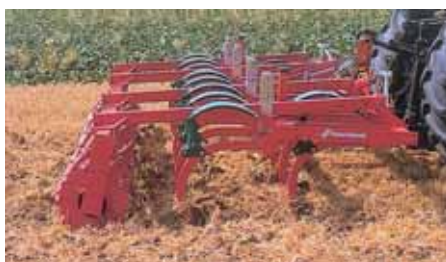
Chisel com braços protegidos por sistema non-stop