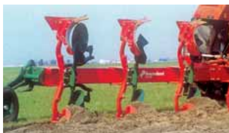
Charrua montada modelo LD, para lavoura rápida e económica; de 2 a 3 ferros