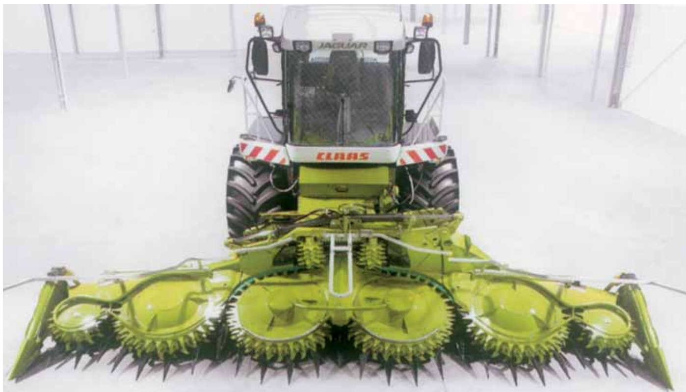
Jaguar 980 com frente para milho, independente do número de linhas, ORBIS (até 10 linhas e 7,5m de largura)

A CLAAS dotou com uma dupla motorização os JAGUAR 970 e 980 , que podem desenvolver respectivamente, 730 cv e 830 cv. Estes modelos topo de gama são equipados com o conceito de motor “ Double Six ” (2 motores de 6 cilindros em linha, idênticos) ligados por uma “Powerband” (correia) permitindo transferir, de forma sincronizada, a potência de 730 ou 830 cv directamente para o dispositivo de corte. Em função das condições de utilização, o trabalho pode fazer-se com um só motor ou com os dois motores.