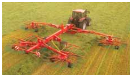
Juntador-encordoador de feno de grande rendimento, com 4 rotores e rodas de suporte