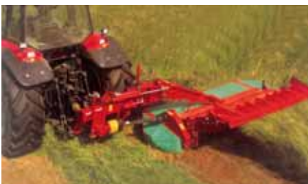
Gadaneiras-condicionadoras rebocadas série 3000, equipadas com sistema Hydro Float de regulação da pressão sobre o solo