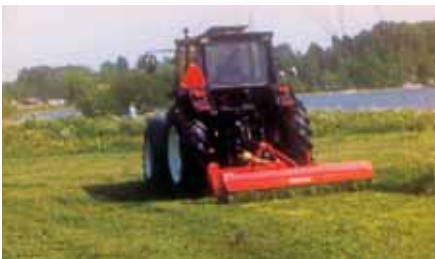
Trituradores série FH de 1,49 e 1,79m de larg. de trabalho, para vinhas, pomares e recorte de restos de culturas arvenses após a colheita (palha, caules de milho, de girassol, etc).