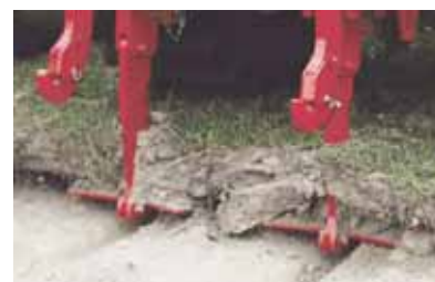
Fig. 4 - Fissuração homogénea do solo: (toda a largura do solo é mobilizada)