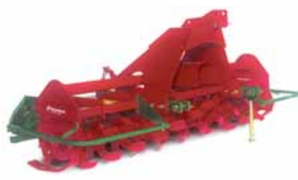
Fresas Mod. GS 120; larg. de trabalho: 220; 235; 285 cm; pode combinar-se com rolos, semeadores, etc