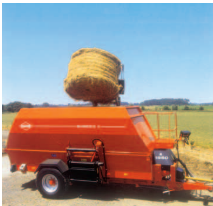
Fig. 1 - EUROMIX II 1860, de 18 m 3