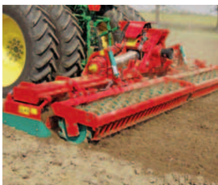
Rototerras (Grades Rotativas de Eixo vertical)