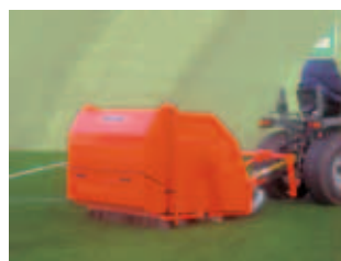
Fig. 7 Aspirador “TERRA CLEAN”: Aspira as impurezas e repõe os aglomerados de borracha

Relativamente aos naturais, os relvados sintéticos são muitíssimo mais baratos. Contudo, uma manutenção regular é indispensável para que qualquer campo de relva sintética possa ser utilizado, em boas condições, durante muitos anos. A Wiedemann desenvolveu também uma série de máquinas para a manutenção completa de relvados artificiais, rapidamente, com segurança e a baixo custo.