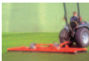
Fig. 8 Escova Multifunções “TERRA BRUSH”, para limpeza de areia e dos aglomerados de borracha e nivelar a superfície