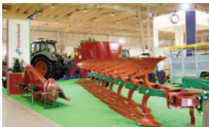
Fig. 3 – Tractores Ibéricos, Lda