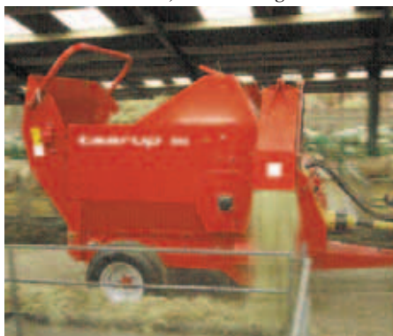
Picador-distribuidor de palha (alimentação e camas)