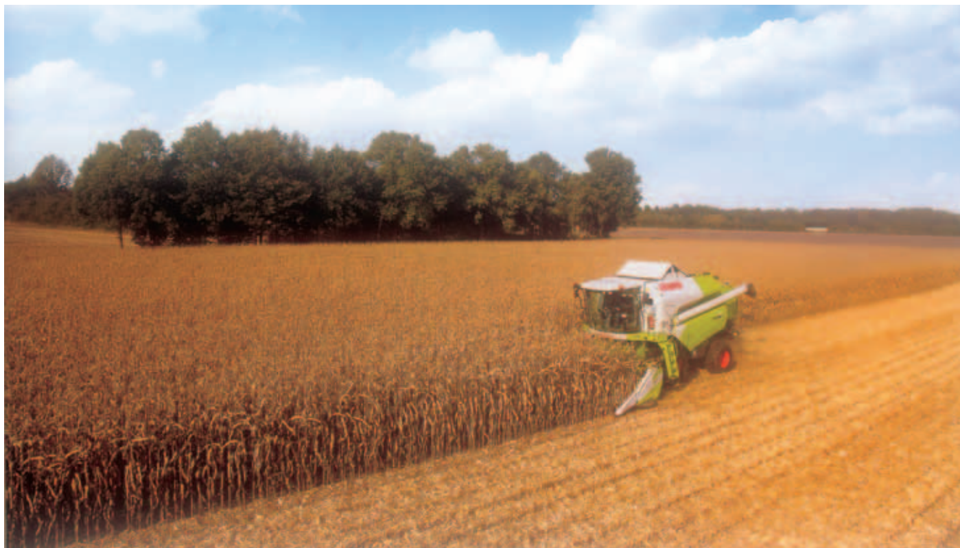
TUCANO 340 NA COLHEITA DE MILHO

As ceifeiras-debulhadoras Tucano são extraordinariamente polivalentes, mediante modificações simples, feitas em tempo record: milho, cereais de Inverno, girassol, arroz, soja, feijão, etc.