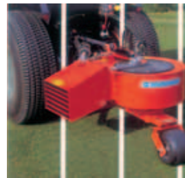
Fig. 5 Soprador de Folhas