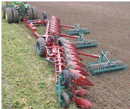
Charrua reversível, semi-montada, articulada + Cultivador Packomat

Nº. 1 Mundial em Máquinas e Alfaias Agrícolas: Preparação do Terreno; Fertilização; Sementeira; Pulverização; Colheita e Tratamento de Forragens; Equipamento Pecuário, etc.