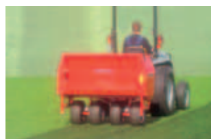
Fig. 9 Espalhador de Areia e de Aglomerados de borracha TERRA TOP 400 : aplicação precisa e uniforme