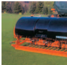
Fig. 3 Descompactador-Arejador