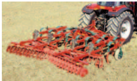
Combinado Chisel + Grade de discos recortados