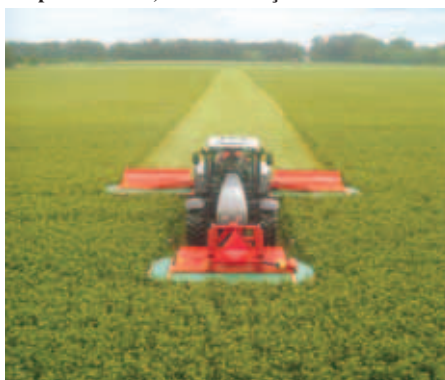
Gadanhadeira montada à frente e atrás, tipo borboleta, c/ 9m de largura