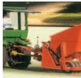
Fig. 6 Espalhador-Autocarregador de Areia