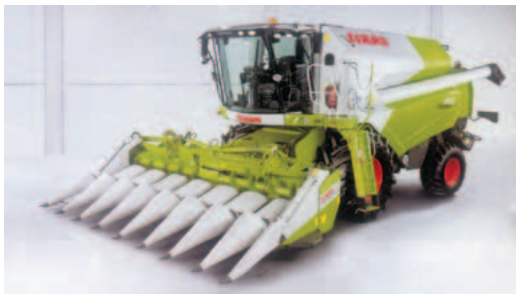
Frente CONSPEED para milho, dobrável