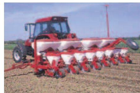
Semeadores de precisão, monogrão, polivalentes