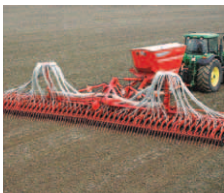
Semeadores em linhas (cereais, etc) pneumáticos, de distribuição centralizada