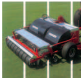
Fig. 2 Terra Combi