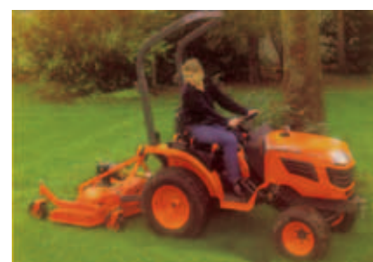
CORTA - RELVAS TRASEIRO