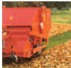
Fig. 4 Varredor-Aspirador