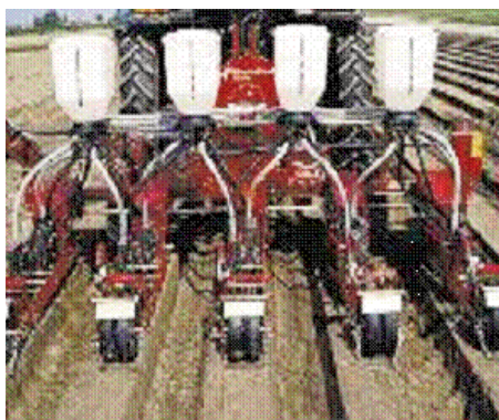
Semeadores de precisão de sementes miúdas (hortícolas)