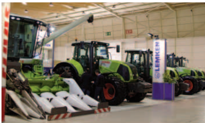
Fig. 1 – Divisão Agrícola