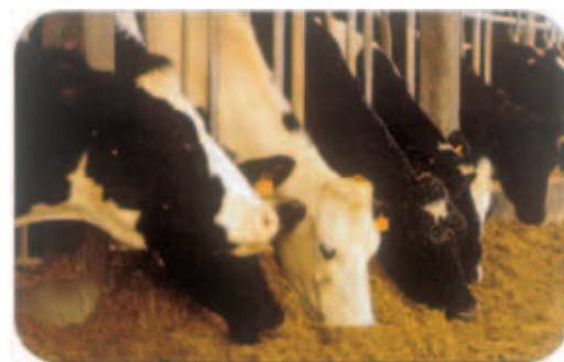
Fig.3 - A polivalência dos EUROMIX II satisfaz as necessidades da maioria dos produtores pecuários