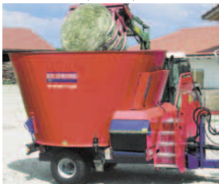
Misturador-distribuidor de alimentos de 1 sem-fim vertical