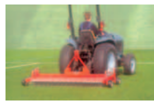
Fig. 10 Ancinho “TERRA RAKE”: rompe a superfície compactada e facilita a infiltração da água; previne o aparecimento de algas e de musgos