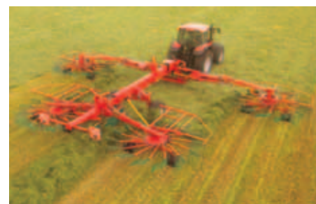
Juntador-encordoador de feno c/ 4 rotores e rodas de suporte