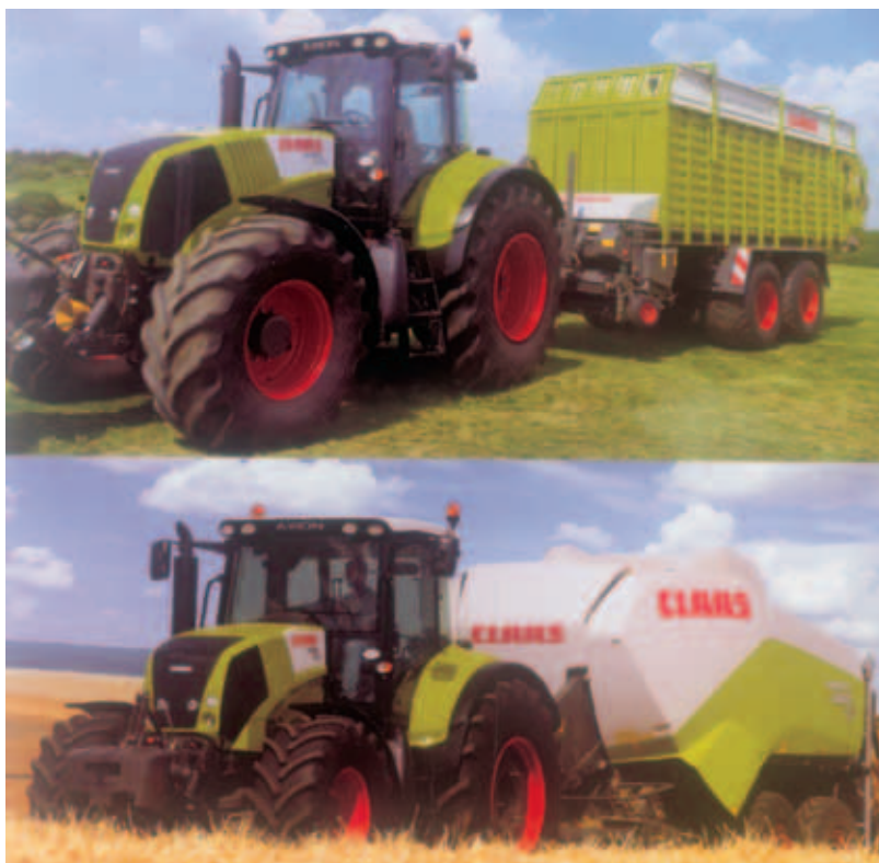
Fig. 1 - TRACTORES CLAAS AXION CMATIC

CMATIC – EFICAZ NO CAMPO, ECONÓMICA NA ESTRADA, A NOVA TRANSMISSÃO CMATIC, DA CLAAS, ADAPTA-SE EM CONTÍNUO A TODAS AS APLICAÇÕES, de 50m/h a 50 km/h