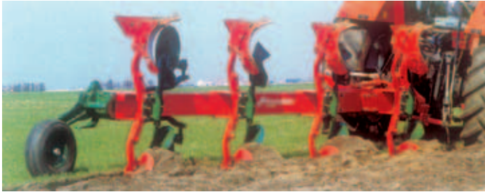
Charrua Montada, modelo LD, para lavoura rápida e económica