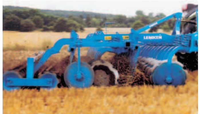
O MODO DE TRABALHO

Cada disco é montado sobre um teiró munido de uma mola pré-tensionada, que assegura sempre uma intensidade de trabalho máxima, mesmo nas condições mais difíceis, e protege a alfaia e o tractor de impactos contra pedras e outros obstáculos.