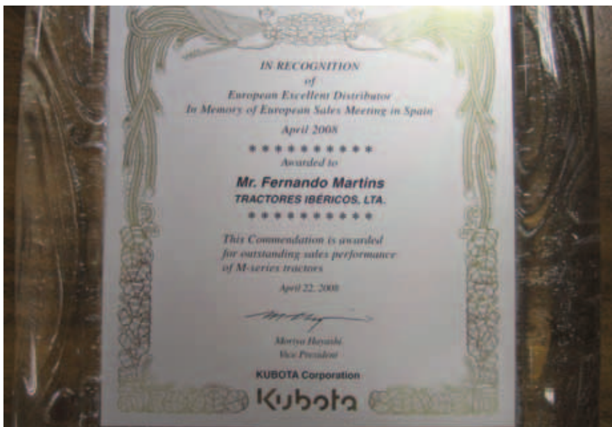
Fig.3 – Ampliação da placa