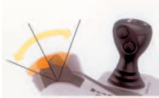
Fig. 2 - Drivestick