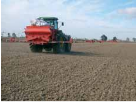
Sementeira de arroz, em seco, na Quinta da Foz - Benavente.

Larg. de trab. 12m (fraccionamento em 4 secções) máxima precisão; turbina accionada por central hidráulica integrada.