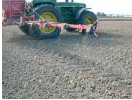
Nesta foto pode ver-se a queda das sementes; Cliente SERVITERRA , prestador de serviços (Porto Alto).