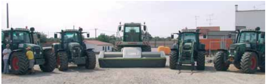
TRACTORES FENDT SÉRIE 700, rodeando o JAGUAR 900 SPEEDSTAR

Finalmente, e não menos importante na nossa opção, agrada-nos imenso que o Concessionário Regional de todas estas marcas (CLAAS, FENDT, KUHN e JOSKIN) seja a Firma MAQUIGUARDA , com provas dadas e excelente imagem, que merece toda a confiança e goza de grande prestígio da parte dos agricultores, está devidamente apetrechada (em pessoal, ferramentas especializadas e peças sobresselentes) e permanentemente disponível para resolver, com competência e rapidez, qualquer problema que possa surgir.