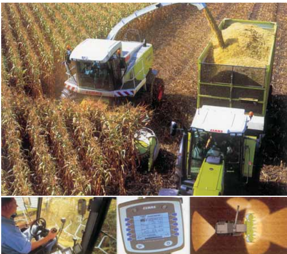
Uma visibilidade perfeita

Na nova série JAGUAR, a CLAAS incorporou todas as vantagens das séries anteriores e aperfeiçoou numerosos pormenores (que a colocam muito à frente da concorrência) visando aumentar a polivalência e o rendimento de trabalho, melhorar a qualidade do produto e rentabilizar a máquina