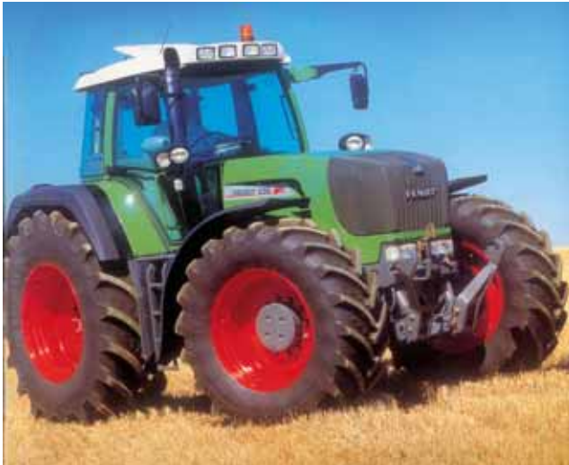
SÉRIE 900 VARIO TMS