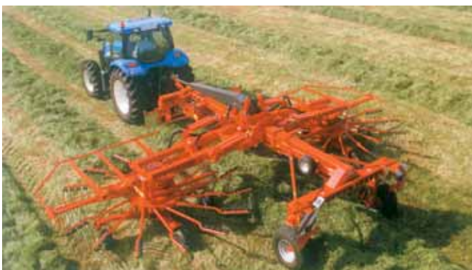
RENDIMENTO EXCEPCIONAL (acima dos 8 ha/h) graças à sua largura (6,70 - 7,30m) ao elevado diâmetro dos rotores c/ 10 braços de dentes e a uma velocidade de cerca de 15km/h.