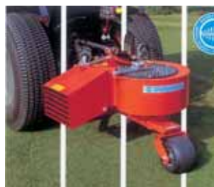
Fig. 5 Soprador de folhas