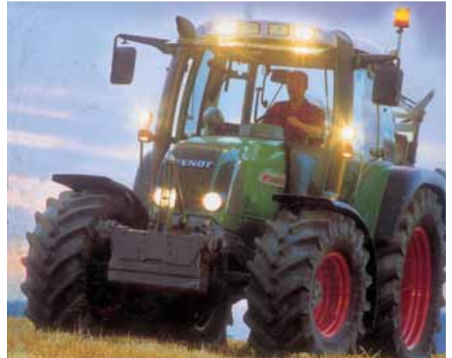
SÉRIE FARMER 400 VARIO

Desde finais de Setembro de 1995, quando do seu aparecimento no mercado, até ao presente, mais de 50 000 tractores FENDT, com transmissão VARIO (das séries 400, 700, 800 e 900 - de 70kW / 95cv a 265kW / 360 cv) trabalham em todo o mundo, incluindo cerca de 4 centenas em Portugal, com completa satisfação dos seus utilizadores.