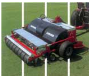
Fig. 3 Terra Combi

A descompactação regular e o arejamento em profundidade são condições primordiais para um crescimento sã das raízes da relva. O trabalho do Descompactador-Arejador Wiedemann proporciona uma melhoria da capilaridade e do arejamento, uma eliminação do feltro da relva e um aumento da resistência ao cisalhamento.