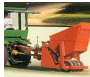
Fig. 6 Espalhador-autocarregador de areia