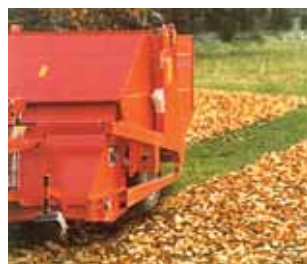
Fig. 4 Varredor-aspirador