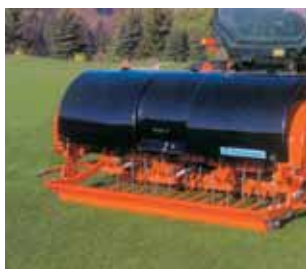
Fig. 1 - Descompactador-arejador