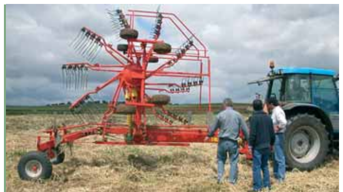
Máquina vendida por SERRAUTO (Moura) pronta para transporte: os rotores são levantados hidráulicamente para a vertical e a grande distância entre rodas e os pneus largos tornam o GA 7301 muito estável nesta posição.